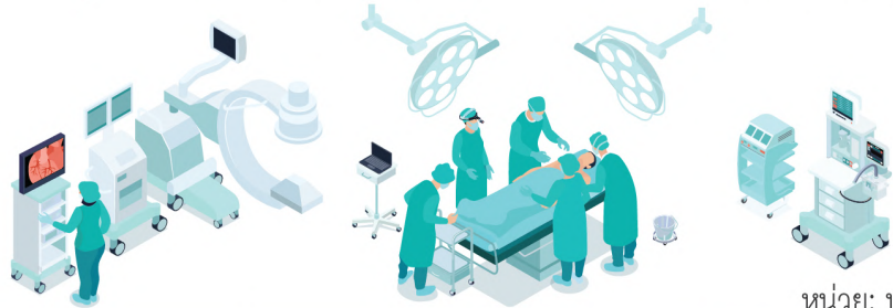
หน่วย: บาท

ช่วงวัยเกษียณ คุณสมมติอายุ 62 ปี (ไม่มีสวัสดิการประกันภัยกลุ่ม): และเข้ารับการผ่าตัดบายพาสหัวใจ ในโรงพยาบาลเป็นระยะเวลา 7 วัน และมีความคุ้มครองจาก AIA Health Plus แผน 5 ล้านบาท ซึ่งเลือกให้ความรับผิดชอบส่วนแรกเปลี่ยนเป็น 0 บาทที่วันครบรอบปีกรมธรรม์ที่อายุ 60 ปี